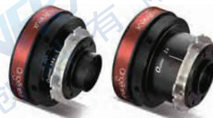
加倍镜1.4x & 加倍镜2x