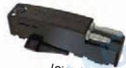
ADS / \delta 技术 安罗镜头数据传输系统