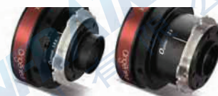
加倍镜1.4x & 加倍镜2x